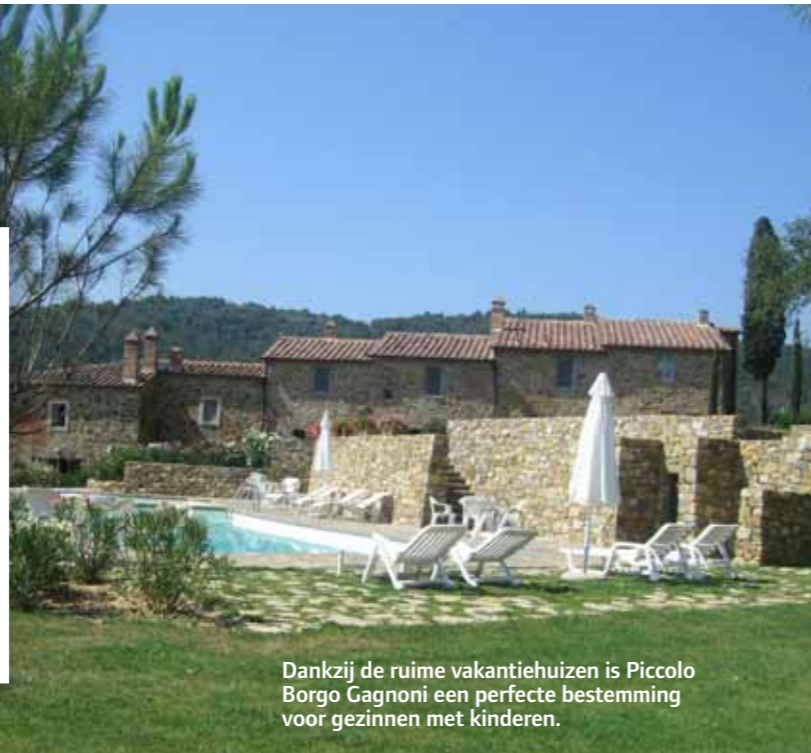
Dankzij de ruime vakantiehuizen is Piccolo Borgo Gagnoni een perfecte bestemming voor gezinnen met kinderen.